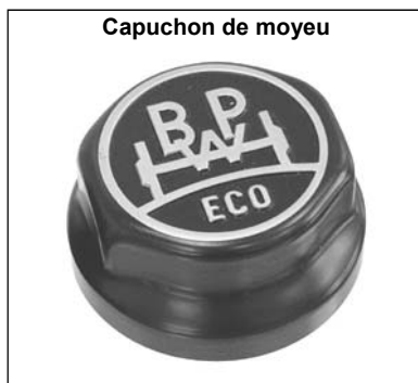
Capuchon de moyeu